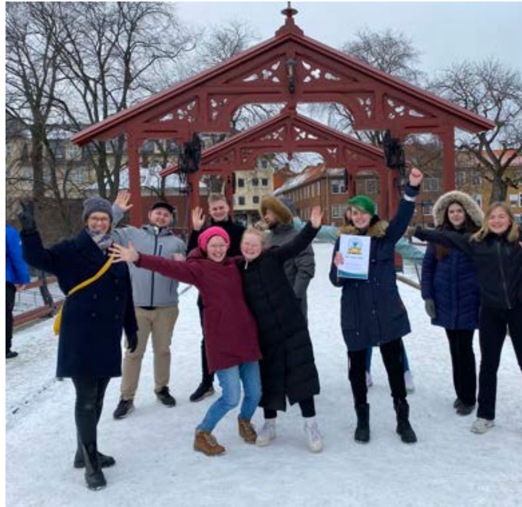
Elevene ved Bybroen videregående skole, som vant NM i klima for store skoler.

Mange loggførte også det å sjekke merkelappene når de skulle kjøpe nye an-